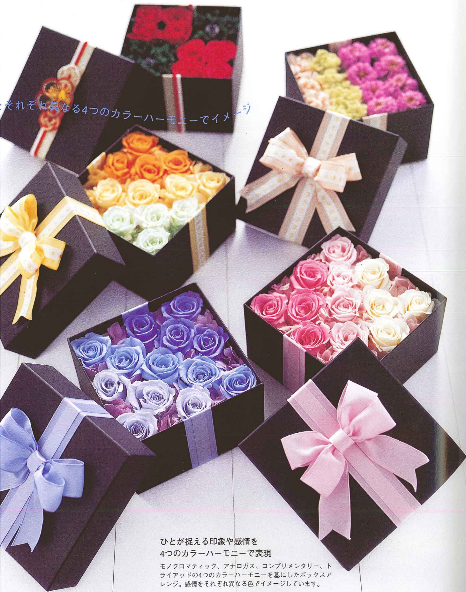
それぞれ異なる4つのカラーハーモニーでイメージ